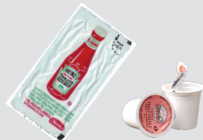
ናይ ቀመም ጥቕላል