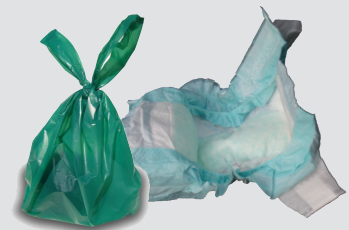
ጨርቂ ሽንቲ፣ ናይ ቤት እንስሳት ሽንቲን ናይ ድሙ ጓሐፍን (ብሳንጣ ዝተገበረ)