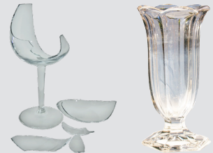
ሴራሚክስን ናይ መስትያት ኣቕሓን (ዝተሰበረ ወይ ዘይጠቕም)