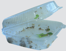
ብምግብ ዝረሰሐ ፕላስቲክ