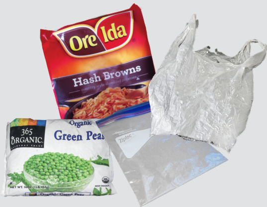
ፍቱሕ ናይ ፕላስቲክ ሳንጣታት