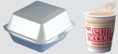
ናይ ስታይሮፎም መትሓዚ