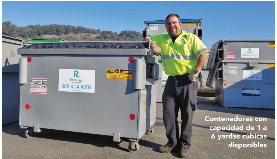
Contenedores con capacidad de 1 a 6 yardas cúbicas disponibles

Tanto si elige el servicio Bin-By-The-Day o pide una o más cajas para escombros para su proyecto de