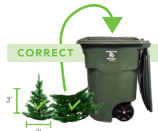
CUT TREE TO FIT