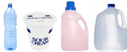
PLASTIC BOTTLES, TUBS, AND JUGS BOTELLAS, BALDES Y JARRAS DE PLÁSTICO