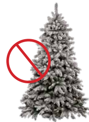
NO FLOCKED TREES

Entrega disponible: Sebastopol City Corp Yard en 425 Morris St, del 26 de Diciembre al 6 de Enero. Los árboles deben desbloquearse quitando las estacas de metal. Los árboles también se pueden cortar para que quepan dentro de su carrito verde, con la tapa cerrada, para recogerlos en cualquiera de sus días habituales de servicio.