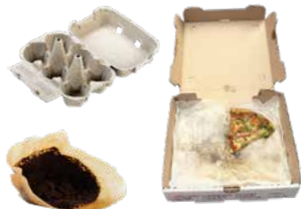
UNCOATED SOILED PAPER PAPEL SUCIO SIN RECUBRIMIENTO