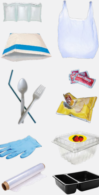
塑料包装、一次性和黑色塑料制品