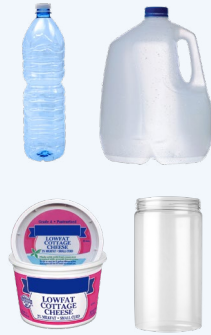
塑料瓶、桶、壶和罐子