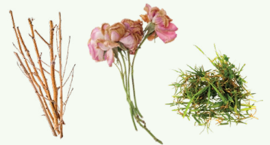
植物和庭院修剪物