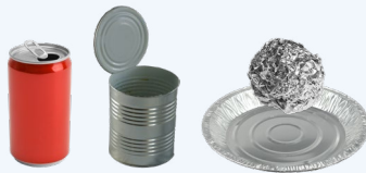
金属罐和盖子、干净的铝箔