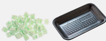
包装和聚苯乙烯泡沫