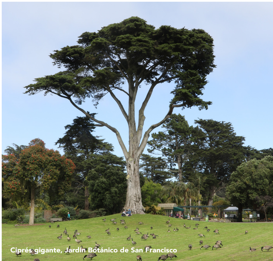
Ciprés gigante, Jardín Botánico de San Francisco

Los árboles nos brindan una gran satisfacción. Ofrecen una grata sombra en los días soleados.