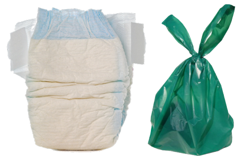
DIAPERS AND PET WASTE PAÑALES Y DESECHOS DE MASCOTAS