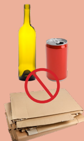
NO RECYCLABLES SIN RECICLABLES