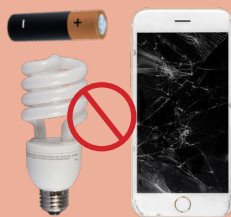
NO HAZARDOUS OR ELECTRONIC WASTE DESECHOS PELIGROSOS O ELECTRÓNICOS NO