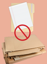
NO PAPER AND CARDBOARD PAPEL Y CARTÓN NO