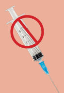
NO MEDICAL WASTE DESECHOS MÉDICOS NO