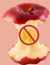
NO FOOD COMIDA NO