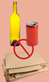
NO RECYCLABLES SIN RECICLABLES