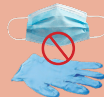
NO PPE EPP NO