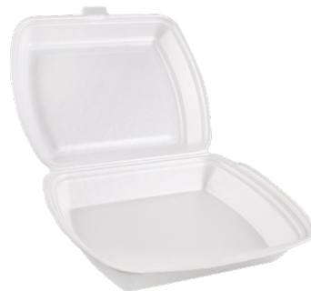
PACKAGING FOAM AND POLYSTYRENE EMBALAJE Y FORMA DE PLIESTIRENO