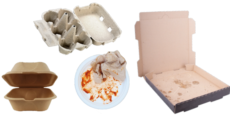
UNCOATED SOILED PAPER PAPEL SUCIO SIN RECUBRIMIENTO