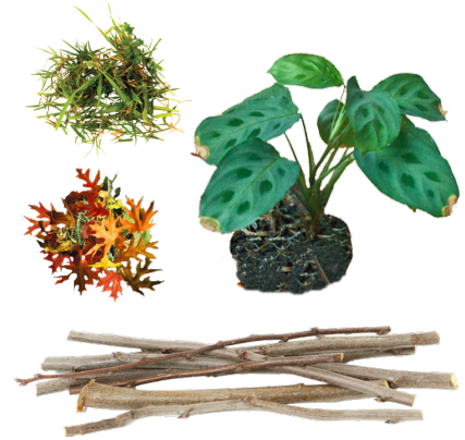
YARD WASTE DESECHOS DE JARDÍN