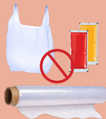
NO SINGLE-USE PLASTIC PLÁSTICO DE UN SOLO USO NO