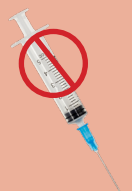
NO MEDICAL WASTE DESECHOS MÉDICOS NO