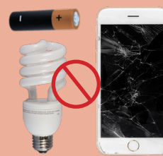
NO HAZARDOUS OR ELECTRONIC WASTE DESECHOS PELIGROSOS O ELECTRÓNICOS NO