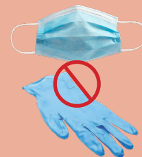
NO PPE EPP NO