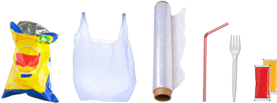
SINGLE-USE PLASTIC PLÁSTICO DE UN SOLO USO