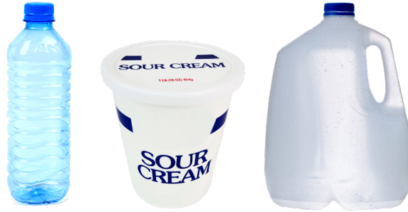
PLASTIC BOTTLES, TUBS, AND JUGS BOTELLAS, BALDES Y JARRAS DE PLÁSTICO