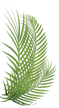
ADELFA, ROBLE VENENOSO Y PALMERAS