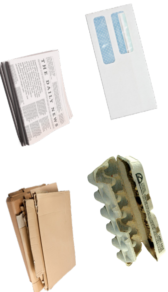
PAPEL Y CARTÓN LIMPIOS