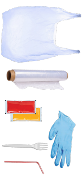
PLÁSTICO DE UN SOLO USO

SI NO ES RECICLABLE NI COMPOSTABLE, VA EN LA BASURA Ayude a reducir la basura en su vecindario. • Utilice bolsas para desechar la basura. • Mantenga cerradas las tapas de los contenedores de basura. • Evite llenar en exceso y bloquear los contenedores.