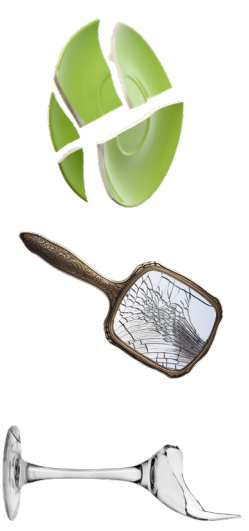
CERÁMICA Y VIDRIO MISCELÁNEO