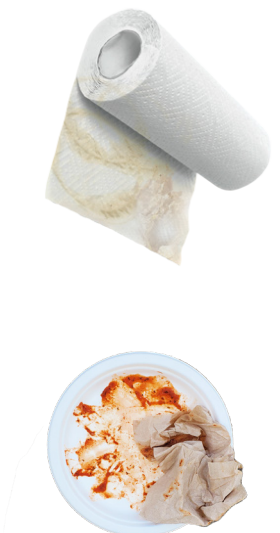
ENVASES DE PAPEL "SIN REVESTIMIENTO" MANCHADOS DE COMIDA