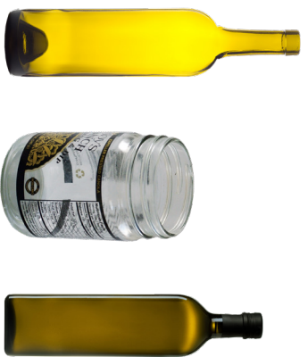
BOTELLAS Y FRASCOS DE VIDRIO

Corte y aplane el cartón para que quepa sin problemas en su contenedor de reciclaje. La espuma de poliestireno y otros materiales de embalaje de plástico deben colocarse en la basura.