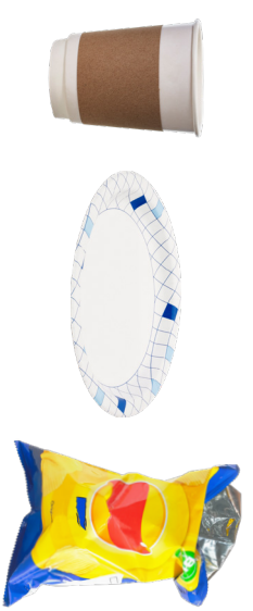
BOLSAS DE BOCADILLOS, ENVOLTORIOS Y PRODUCTOS DE PAPEL CON REVESTIMIENTO