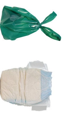
PAÑALES Y DESECHOS DE MASCOTAS EN BOLSAS