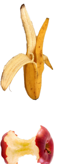
RESTOS DE COMIDA