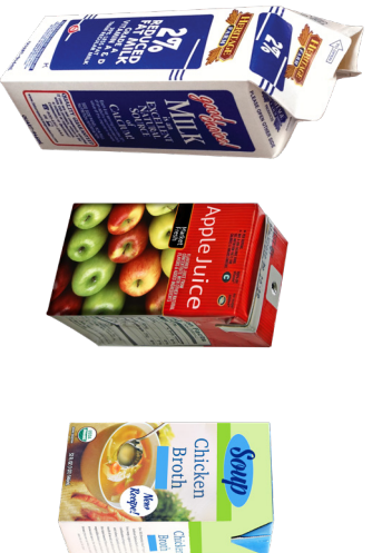
ENVASES ASÉPTICOS Y DE CARTÓN