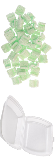
EMBALAJES Y ESPUMA DE POLIESTIRENO